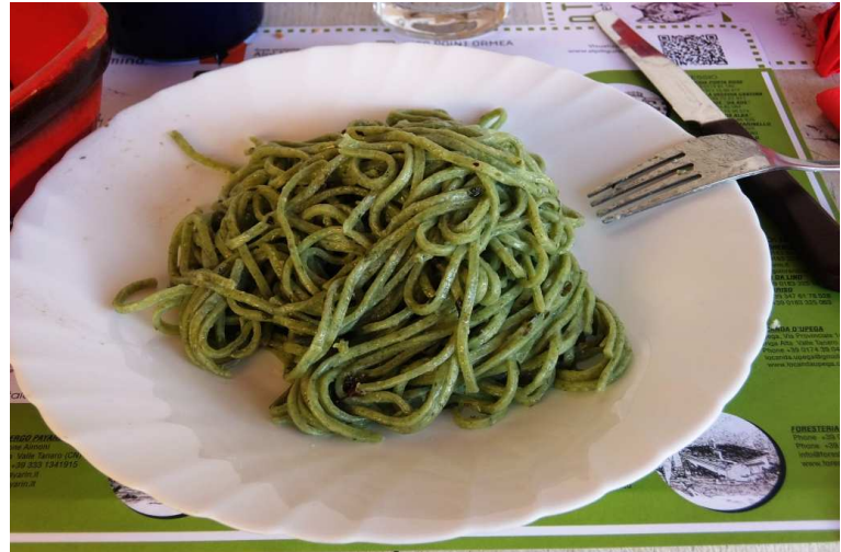
Castagno con circonferenza da 9 metri a Porcirette Sott.(Balconata d'Ormea) perso nell'ultimo giro. Rifugio Chionea: Fettuccine verdi all'erbette! (tel. 3282131183)