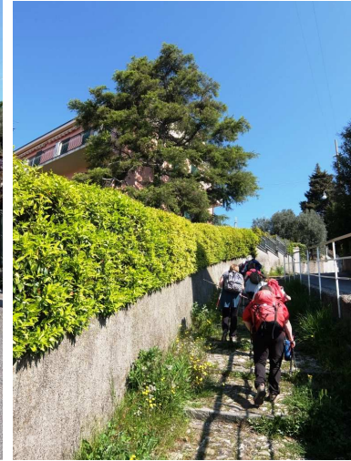
La partenza è a Sturla da via 5 maggio (fermata bus lato monte, vicino pizzeria Punta dell'Est). Si prende una stretta viuzza tra gli edifici, via S. Gerolamo di Quarto