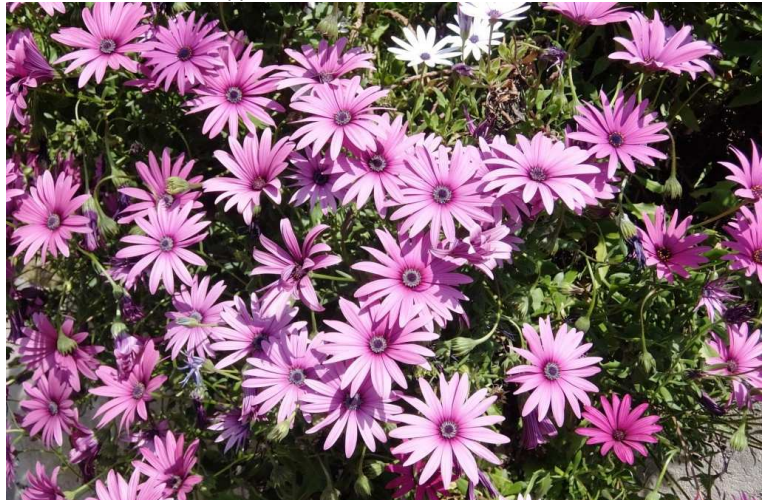
Esplosione di primavera... (1h30 x il rientro)

In definitiva: Diff. T - disl. 500 mt - 11 km (+4)- 3h30 circa tot (+1h). + le soste - tempo: buono. Comodità percorrenza: ottima. Periodo migliore: dall'autunno alla primavera, evitando le giornate più fresche. Interesse giro: medio