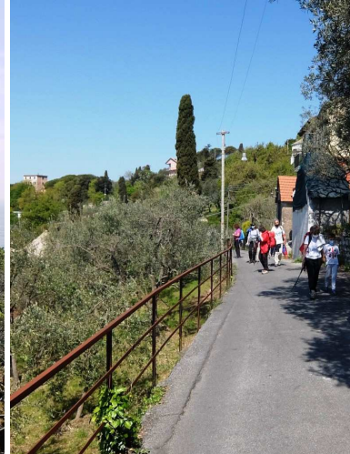
...sul divieto di passaggio dei carri). In sequenza, in salita, si seguono: via Redipuglia, S.Gerolamo, Sciaccaluga, Cembrano, Pescia, Swinburne, Dezza, Olivieri, Cappella e Bocciardo, arrivando nel quartiere d'Apparizione (200 m - 50' di cammino da Sturla).Dopo, si insiste per Salita Carupola e via Canneto di Apparizione (300 m).