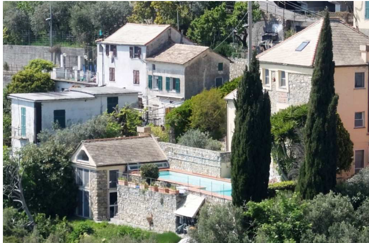
Piscina tra gli edifici della frazione