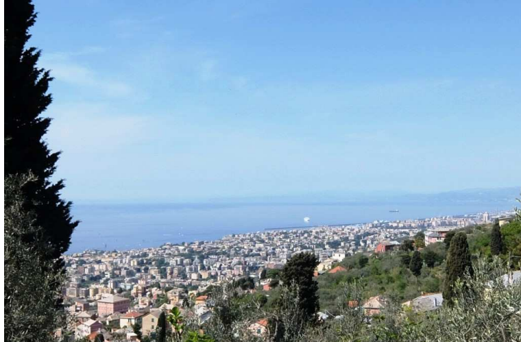
(spicca una targa con scritta del 1894....