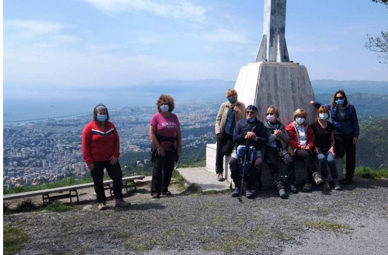
Giornata piacevole, lunga sosta. Il rientro è per l'andata poi però si varia insistendo