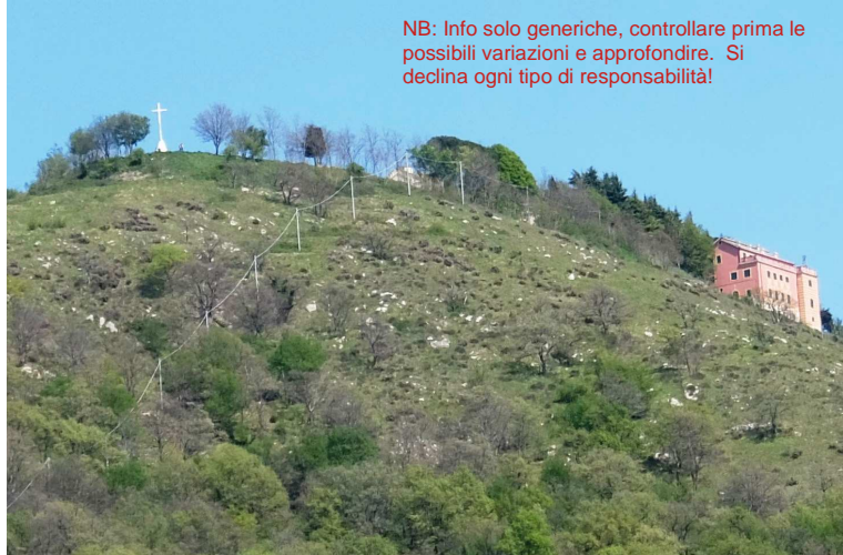
Se dalla città si vede il Fasce, allora spicca la meta della gita: la casa rosa isolata ben sotto la vetta... Apparizione ↑

NB: Info solo generiche, controllare prima le possibili variazioni e approfondire. Si declina ogni tipo di responsabilità!