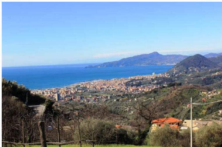
La vista si apre a dismisura sulla linea di costa, in un ambiente più aperto