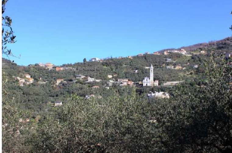
chiesa di San Lorenzo