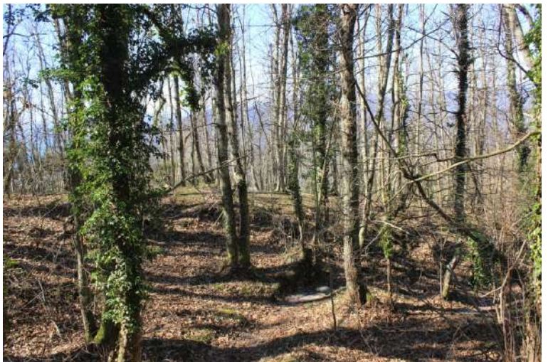
La discesa parte proprio di fronte all'edificio sacro ed è ben evidente: qualche freccia blu e