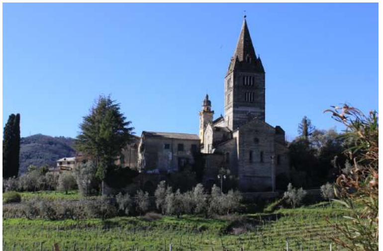
Alla fine, si sfiora la Basilica dei Fieschi e, continuando su asfalto, si rientra nella parte centrale di Cogorno, dove conviene lasciare l'auto al mattino perché a Lavagna è più complicato lasciare il mezzo In estrema sintesi: Dif. E/T, 2h30 andata (compreso 30 x approccio) e 1h30 ritorno, circa 10,5 km, quasi 550 mt disl.