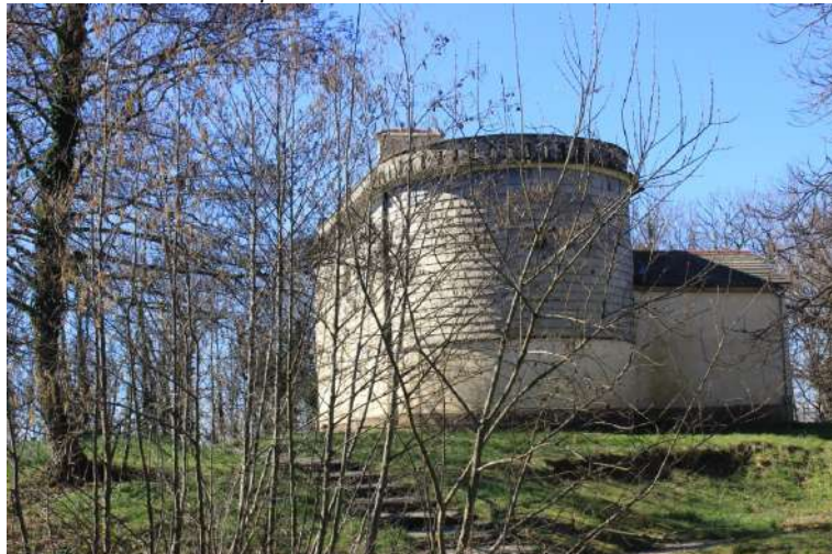
NB. L'ardesia è una roccia che può essere divisa in lastre, che risultano impermeabili e leggere. In Liguria, si trovano, facilmente, nella zona costiera tra Lavagna, Chiavari e in val Fontanabuona. Sopra Lavagna, ci sono diversi sentieri lastricati che venivano usati per il trasporto a valle del prodotto. Tale operazione era portata a termine dalle donne che posavano sulle loro teste fino a 50 kg di materiale! Un lavoro quindi durissimo ripetuto con viaggi fino a tre o quattro volte al giorno. Questo è il contesto in cui ci si muove, durante l'escursione.