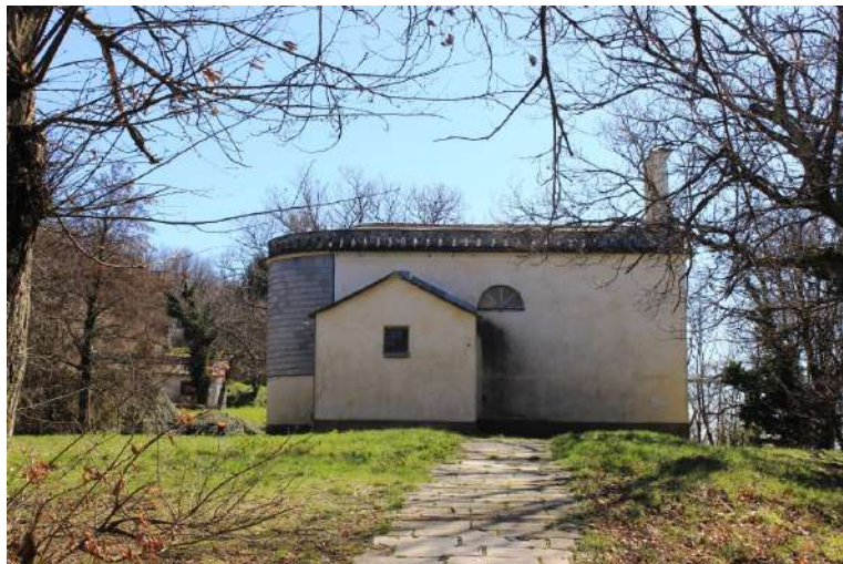
La capelletta del Monte San Giacomo (sosta pranzo)