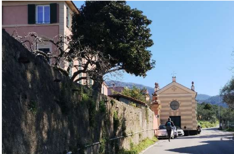
PL Da qui partono i simboli FIE che rimontano attraverso scalinate, stradine pedonali, bei lastricati, creuze, ect. tra muretti, ulivi e fasce coltivate...