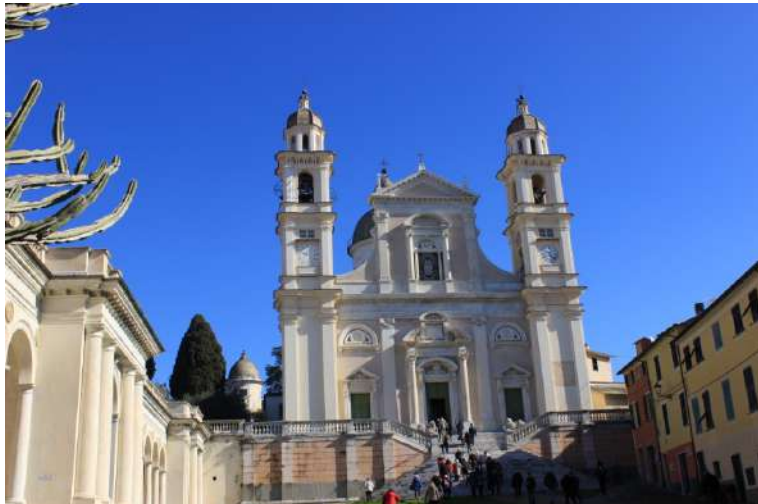
Basilica di Santo Stefano a Lavagna.