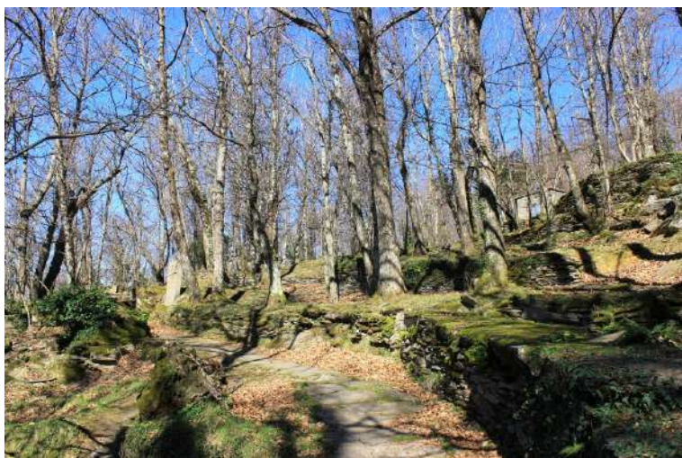
PL Il tratto più bello! In mezzo a un bellissimo bosco! Un cartello avverte che si cammina sul sentiero delle portatrici di ardesia