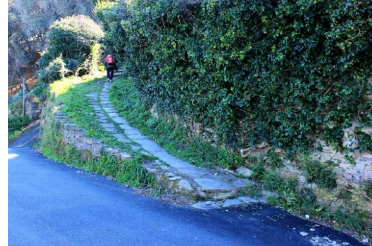
A volte, ci sono pure delle vecchie frecce rosse ad aiutare