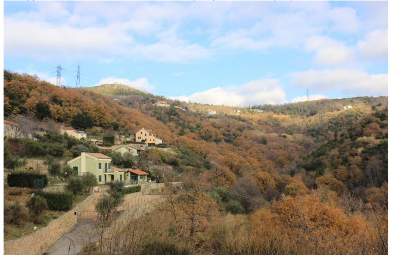
Ritornati sui propri passi, lo sterrato taglia la montagna e dovrebbero esserci diversi pannelli didattici, ma se ne vedono solo alcuni... Si sfocia su asfalto (25') e, poco sopra, c'è un grande piazzale, ma si scende, invece, subito a sinistra. Ignorato un primo bivio, al secondo si svolta a destra (direzione Conca Verde ).