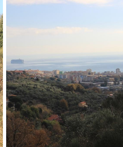
A destra, si può deviare per visitare, sommariamente, la struttura che è in abbandono (quindi con la massima attenzione!) a quota 235 m (25').