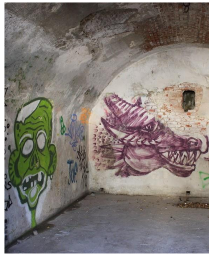
Infatti, al successivo incrocio, si gira a sin. in forte ascesa. Si intravedono le mura del forte, costruito dai Sabaudi (1881), immettendosi nella sua strada di accesso.