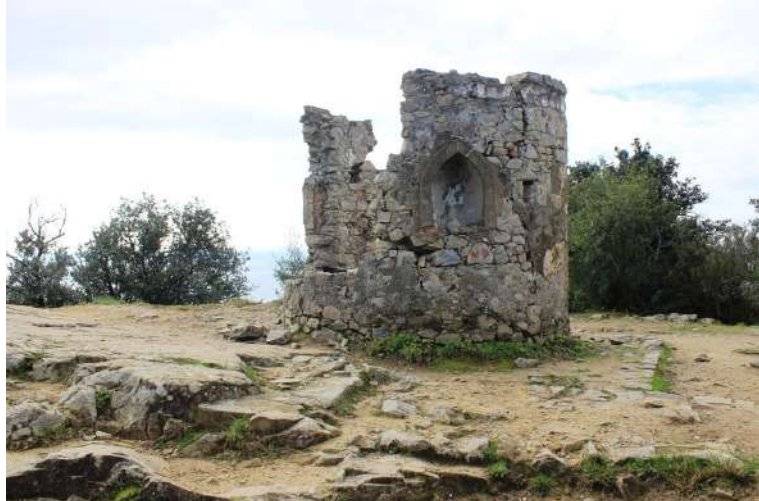
circa 1h15 per l'arrivo. Poi moltissima gente: una infinità; però si riesce a fare, incredibilmente, una foto solitaria!