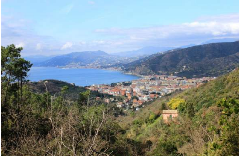
il rientro, passando dalla loc. Mandrella e poi tagliando all'interno per tornare indietro, richiede circa 1h30 più qualche pausa

Foto singole al link http://www.cralgalliera.altervista.org/anno2025.htm Info aggiuntive (mappe, pannelli, notizie, etc. q. p.) solo per i soci iscritti alla Sez Esc Cral Galliera!