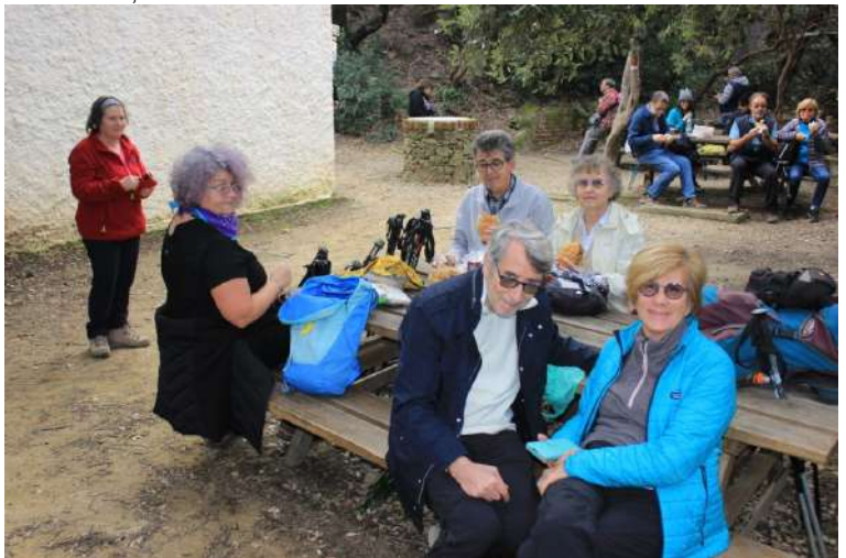
X le info sul tracciato far riferimento a http://www.cralgalliera.altervista.org/RivaTrigosoPuntaManara022.pdf Luogo super vicino: http://www.cralgalliera.altervista.org/1712A4Ciappalupo.jpg