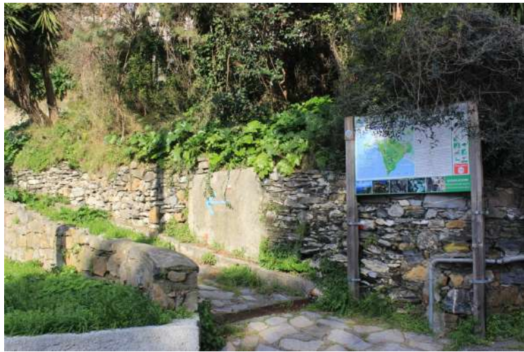
Si parte dalla loc. Le Rocche. Per evitare la salita più ripida, si segue, per un paio di tornanti, l'asfalto