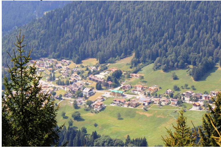
Panorama su San'Antonio di Mavignola (30')