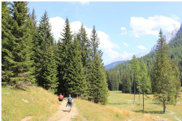
...che si raggiunge scendendo per 30 ' fino alle sponde del lago 1596 m