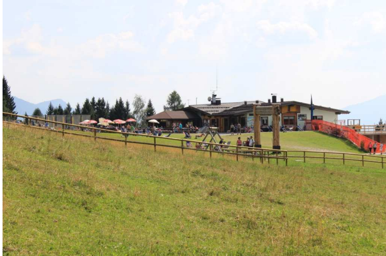
...chiusa! Seguendo la pista da sci in altri 20' si ritorna a Pra Rodont. Qui un'altra sosta e con l'auto (si segnala che i posti non sono tantissimi. . .) si scende a Pinzolo e si ritorna a Folgarida. In definitiva: Bella giornata disl quasi 250 mt Dif. T/E (il ritorno è quasi tutto non segnato) per circa 3h30 Tot. (1h30 and. e 2h rit.) + tutte le pause x vedere i vari luoghi che si incontrano