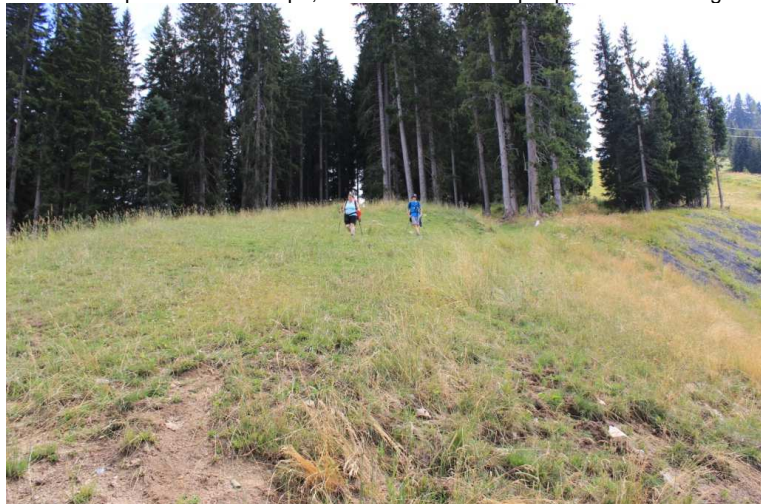
Si sbucca da una doppia stazione di sci invernale 1664 m (20'). Qui si segue la strada bianca continuando sulla direzione principale e ignorando alcune deviazioni. Su questo lungo tratto non incontriamo nessuno tranne un ciclista; per motivi sconosciuti tutto il lato Nord è ignorato ingiustamente dal punto di vista escursionistico.