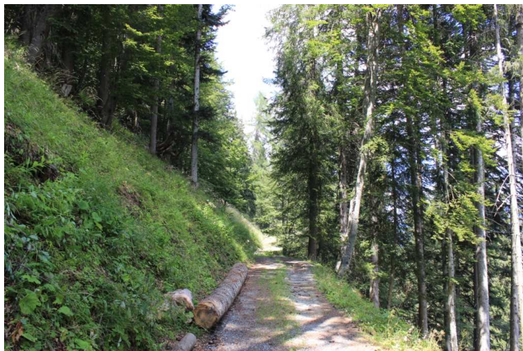
La strada dopo 30' si interrompe; la traccia si riduce e per pochi metri la vegetazione quasi la cancella, poi per fortuna tende ad allargarsi di nuovo (nessun simbolo).