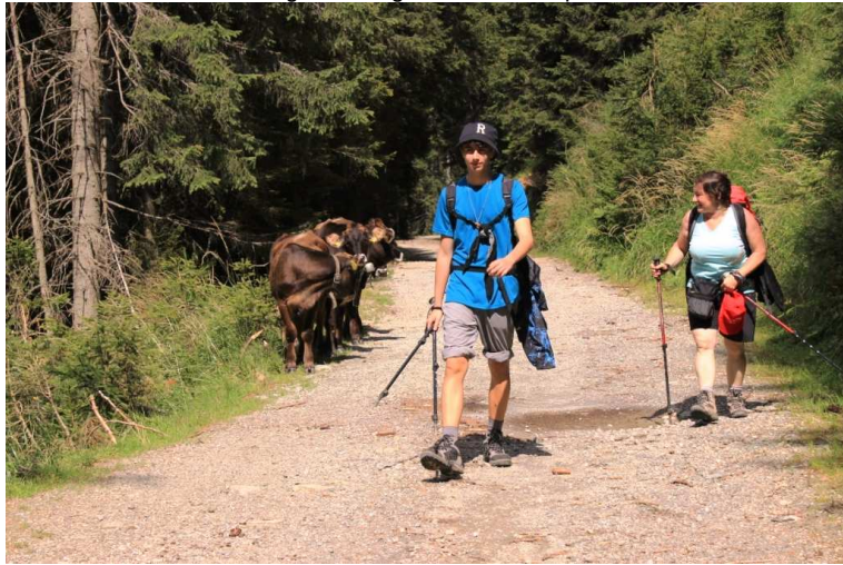
Da un bivio si sceglie di passare da Malga Cioca 1722 (20') che però risulta. . .