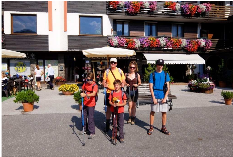
Con i mezzi pubblici si raggiunge il passo Carlo Magno 1681 m e il sentiero