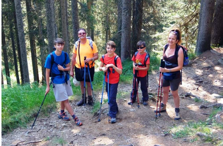
segnato si snoda nella fitta foresta di altofusto di Palù della Fava. Proprio all'inizio un cartello avverte che in zona ci sono Orsi e raccomanda in caso di incontro...