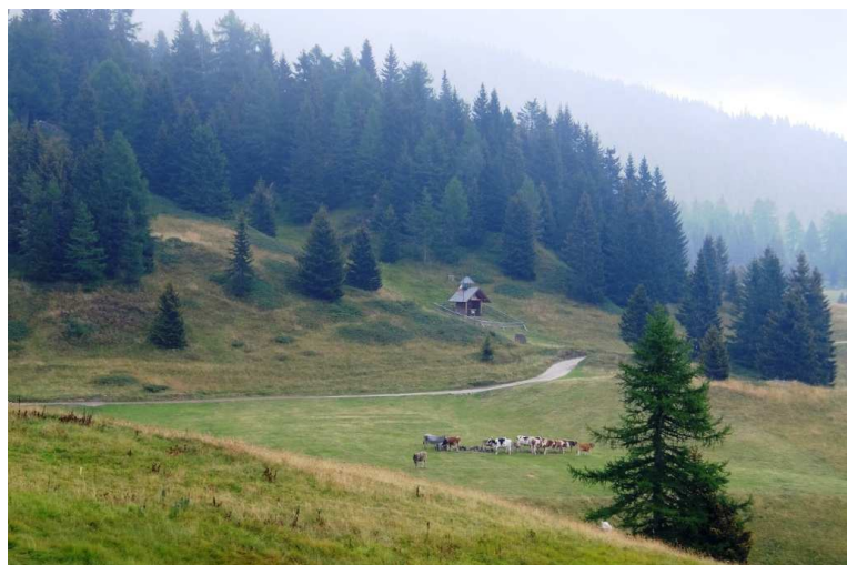
... Lo si segue per un breve tratto scendendo fino alla zona della radura Pra del Signor