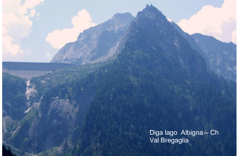
Diga lago Albigna - Ch Val Bregaglia