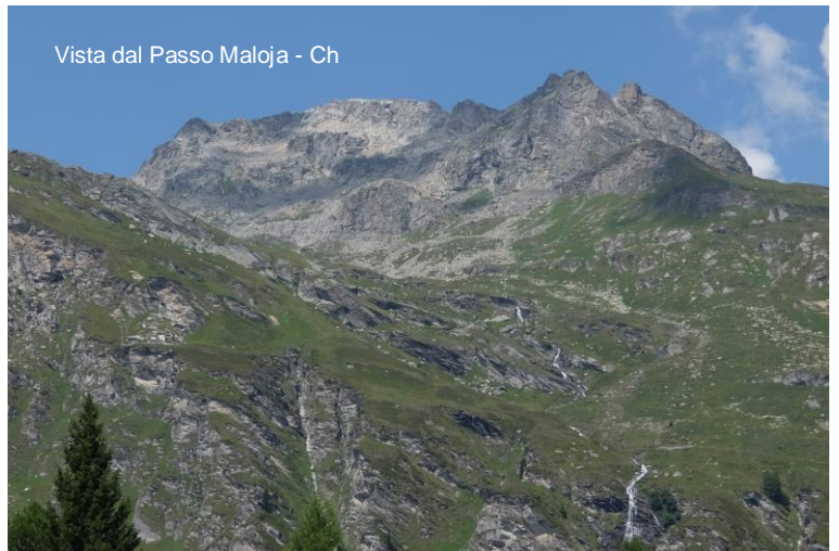
Vista dal Passo Maloja - Ch

Si passa il confine con la Svizzera e si entra nell'alta val Bregaglia, anch'essa di lingua italiana. Si supera il passo Maloja, e con percorso pianeggiante, San Moritz.