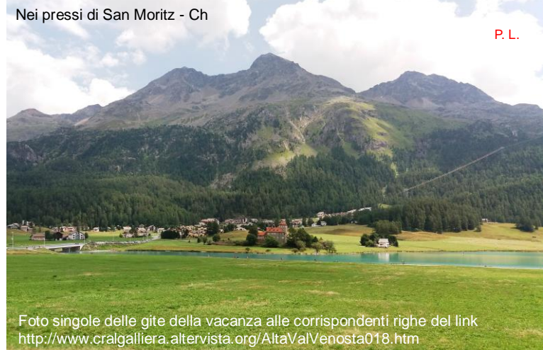
Nei pressi di San Moritz - Ch

Si passa il confine con la Svizzera e si entra nell'alta val Bregaglia, anch'essa di lingua italiana. Si supera il passo Maloja, e con percorso pianeggiante, San Moritz.