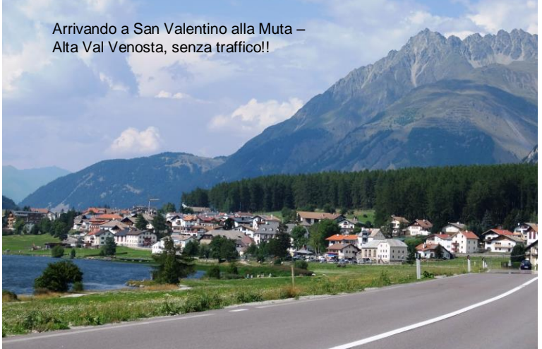
Arrivando a San Valentino alla Muta - Alta Val Venosta, senza traffico!!

Si prosegue e da Zernez si svolta a destra per Santa Maria e Mustair (ignorando poi la deviazione a pagamento x Livigno e svalicando il passo del Fuorn a 2150 m). Si rientra in Italia a Tubre e passando da Malles si risale a San Valentino alla Muta (circa 80 km più corta rispetto al passaggio dall'A22!), campo base della vacanza Approfondimenti (mappe, pannelli, notizie, etc. q. p.) solo per i soci assicurati; altre info: http://www.cralgalliera.altervista.org/esc.htm