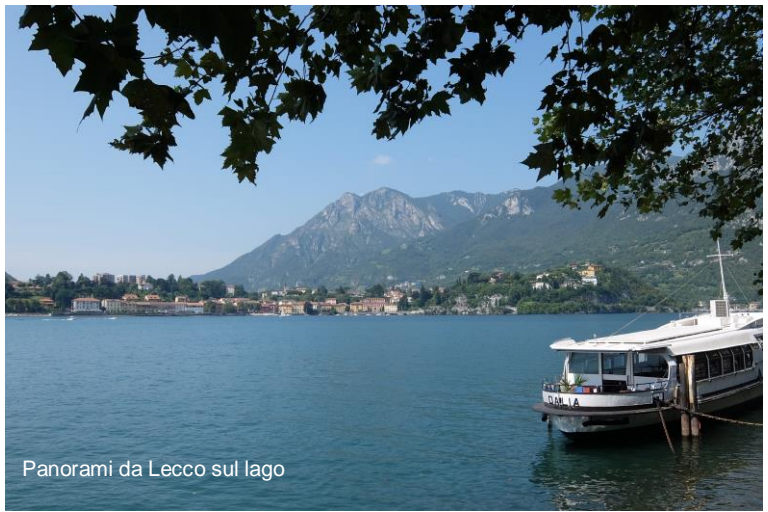
Panorami da Lecco sul lago