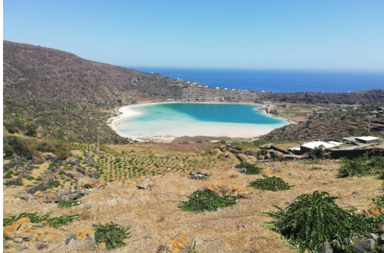
Specchio di Venere

L'isola di Pantelleria è grande circa 80 km 2 e si trova a in una posizione che la pone molto più vicina alla Tunisia che alla Sicilia (65 km rispetto a 110 km). La 'Montagna Grande' raggiunge un'altitudine di 806 m. Il porto ha collegamenti regolari con Trapani, ma è pure presente un aeroporto con voli regolari con la terraferma.