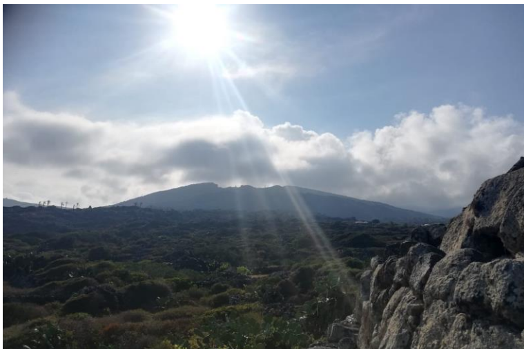
Molto famosi sono i "giardini panteschi", costruzioni per proteggere le piante dai forti venti che ci sono in ogni stagione.