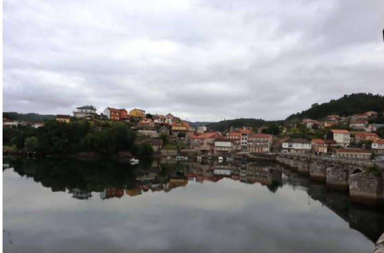
bosco; in seguito, c'è Arcade. Si devia per vedere l'Atlantico, anche se, in realtà, è solo il fiordo (ria) di Vigo. Dopo una pausa e alcuni acquisti per il pranzo (utili visto che non si incrocerà quasi nulla...), si supera il ponte Sampaio, protagonista nel 1809 di uno scontro tra spagnoli e invasori francesi. S risale rientrando nel bosco