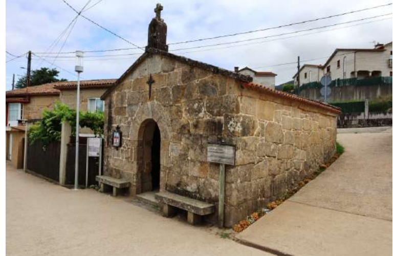
si raggiunge la Capela de Santa Marta en Bértola (Vilaboa): è un piccolo edificio sacro in pietra datato 1617