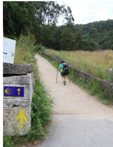
Il percorso risulta molto riposante per il tanto verde. Non si notano ristoranti se non alcuni di tipo... volante... con camioncini attrezzati o similari Tutte le info sul Camino 2023: http://www.cralgalliera.altervista.org/CaminoPortugCen023.htm

NB: Info solo generiche, controllare prima le possibili variazioni e studiare a fondo. Si declina ogni tipo di responsabilità!