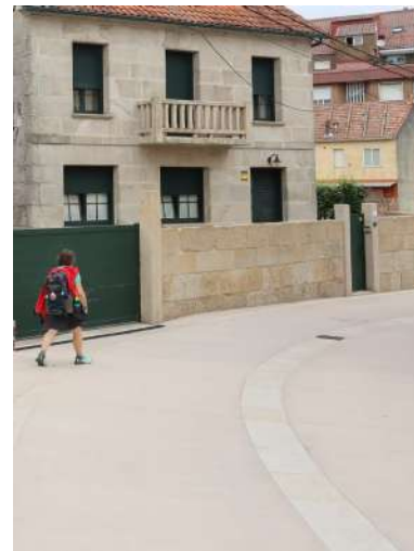
Partiti dall'abitato, si intravede un buon punto panoramico verso il mare. Lasciata la parte più antropizzata (superando la strada un paio di volte volte), si entra nel