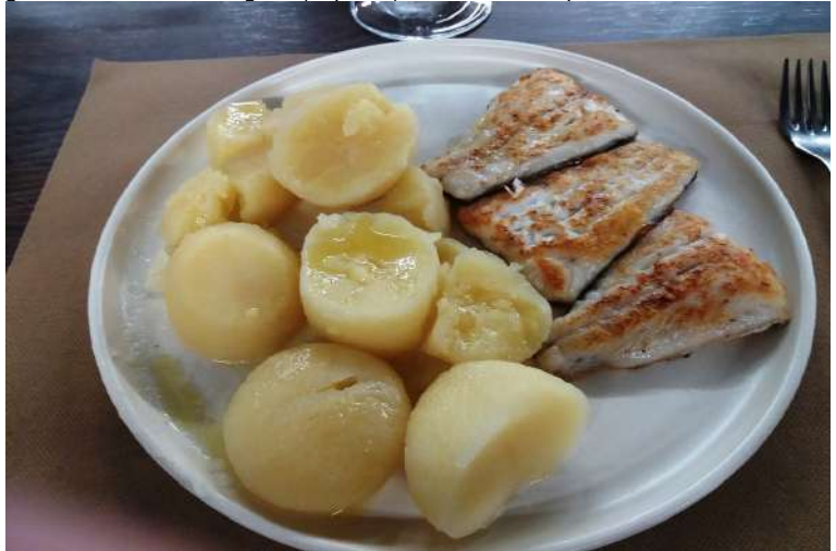
l'odierna tappa termina a Pontecesures; Padron è poco più avanti... La sera a cena si assaggia un ottimo filetto di merluzzo dal gusto molto delicato... PL In estrema sintesi. Dall'hotel al punto di arrivo: 16,5 km, circa 5h di marcia e 2h di pause, 3,3 km/h, 150 mt disl. Ragguagli aggiuntivi (mappe, pannelli, notizie, etc. q. p.) solo x i soci iscritti alla Sez.Esc.CralGalliera Approfondimenti http://www.cralgalliera.altervista.org/esc.htm Foto gite e scatti singoli http://www.cralgalliera.altervista.org/anno2023.htm e http://www.cralgalliera.altervista.org/altre2023.htm