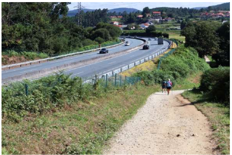
Si fiancheggia brevemente l'autostrada: ogni tanto capitano cose simili, non essendo in piena montagna ma facendo una via in un territorio densamente abitato...