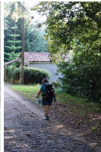
Si attraversa la cittadina di Caldas De Reis e dopo si entra in bosco abbastanza fitto