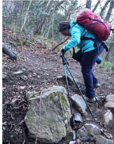
...Una volta che incomincia la discesa verso la Valpolcevera - Camporsela tra gli alberi - unico passaggio un po' + impegnativo, niente di che...