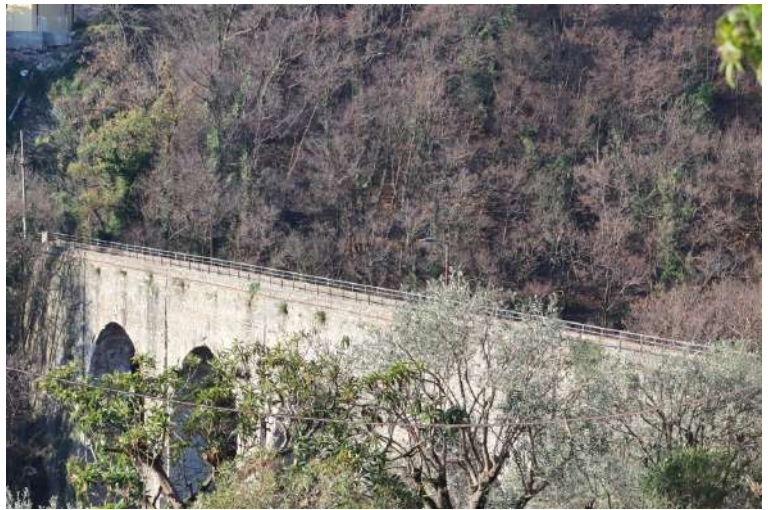
Da via Piacenza, la salita (scalinata) si inerpicava lungamente attraversando alcune volte l'asfalto. Si incrocia il percorso dell'acquedotto storico