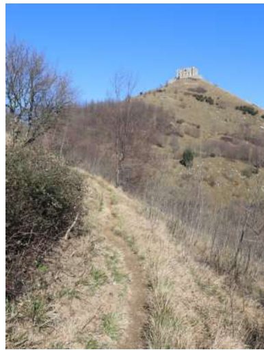
Neviera E' ben segnato (simboli Fie), tranne un bivio (prima di un passo), fino al valico (35' - 555 m) sotto il forte Diamante, poi la situazione peggiora...