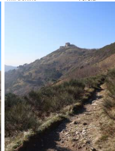
1h10 fino alla pista dell'acquedotto Val Noci - Retrospectiva sulla salita fatta - Ci si innalza ancora: Forte Diamante e Forte Puin Accesso: Si risale la Valbisagno, oltre il viadotto dell'autostrada. Dopo la rimessa Amt delle Gavette e prima di una farmacia, sulla sinistra c'è l'inizio del percorso.