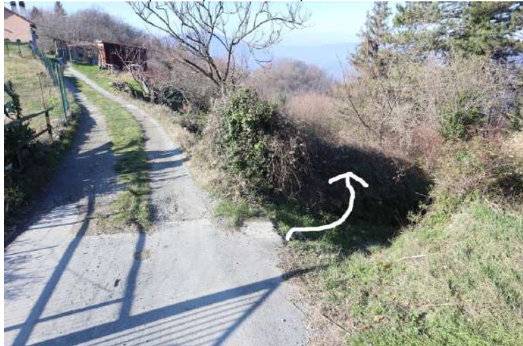
Giunti sulla strada si piega, immediatamente, a sinistra (freccia errata su pannello)