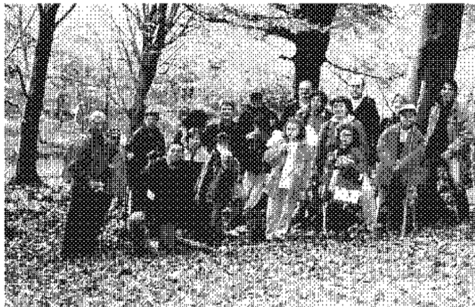
Nella laggiola delle Rocce dell'Adornata - 22 ottobre 2000